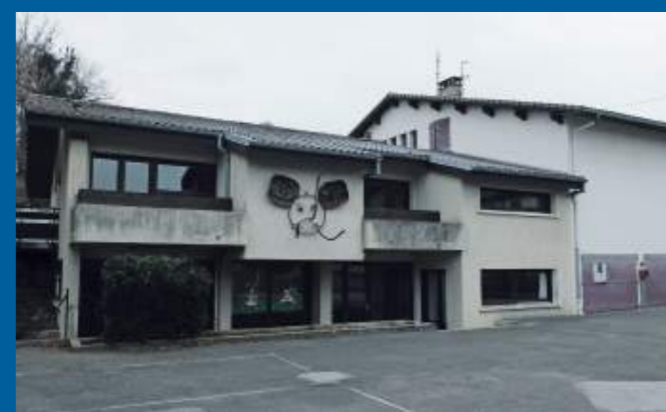
Bât. 1 - salles, garage et local technique