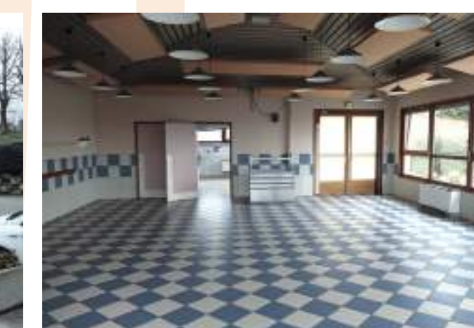
Bât.3 - restaurant scolaire