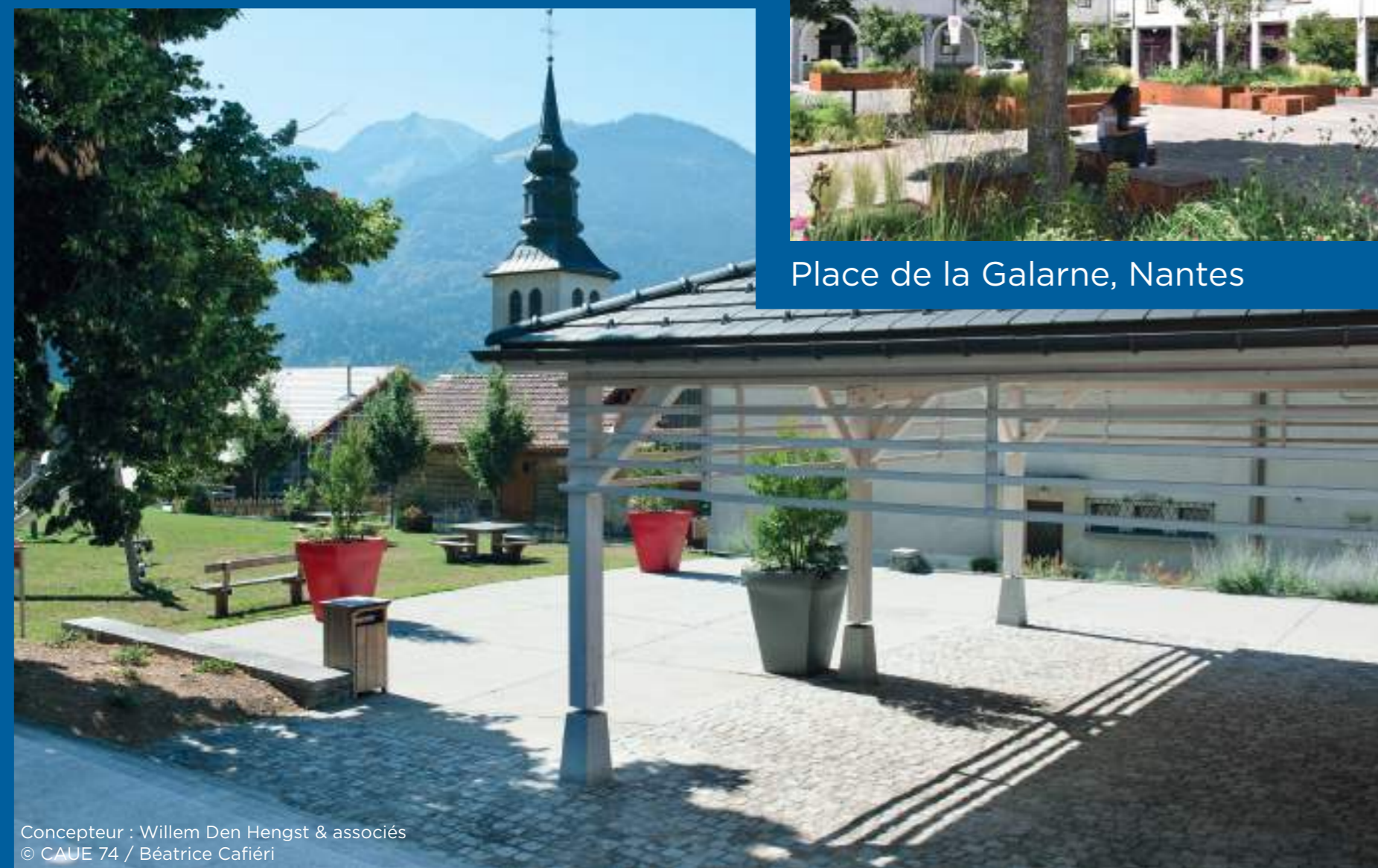
Concepteur : Willem Den Hengst & associés