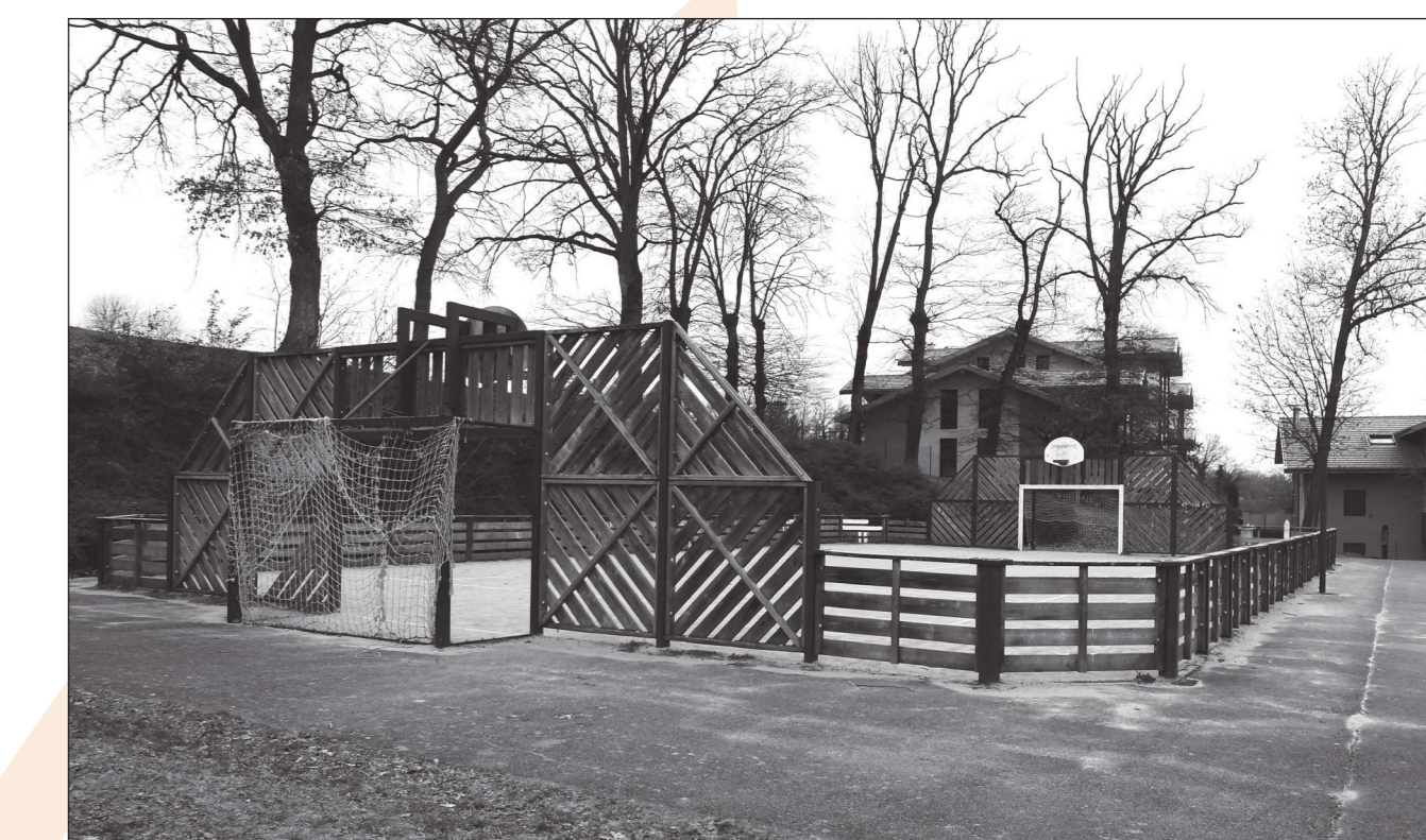
Cour de l'ancienne école maternelle et terrain de sports