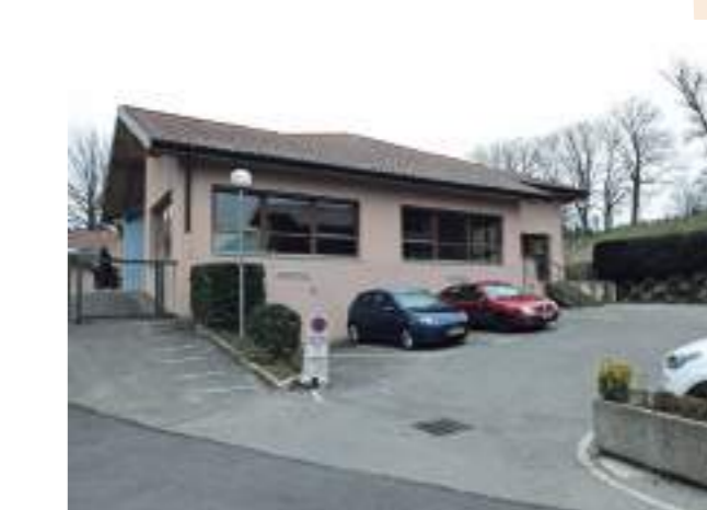
Bât. 3 - restaurant scolaire et parking adjacent

Cette salle et sa cuisine équipée sont en très bon état, il est donc proposé une réaffectation sans travaux en une salle polyvalente. Elle pourrait facilement être utilisée pour de petits événements par les associations, les particuliers et la commune.