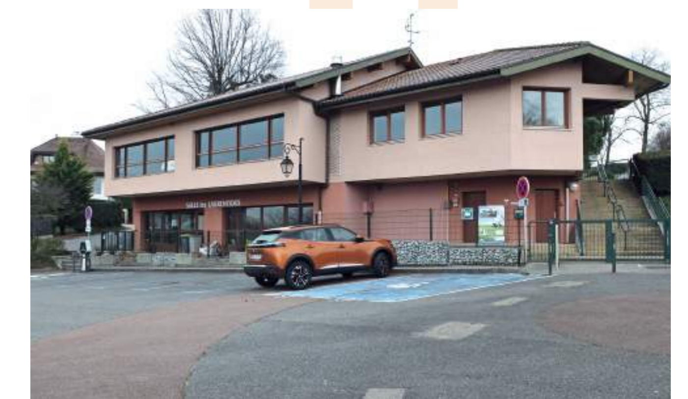
Bât. 4 - les Laurentides, espace donnant sur le parking