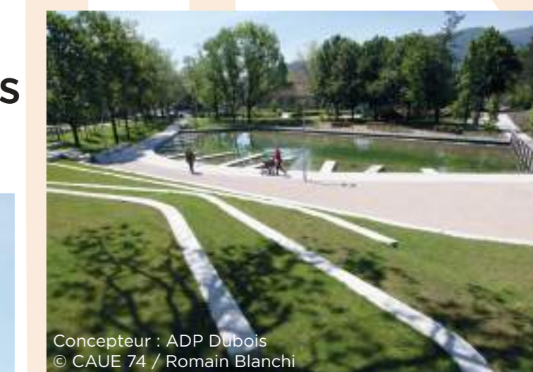
Concepteur : ADP Dubois Parc Jean Bauquis, Ambilly