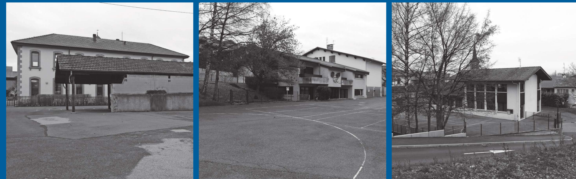
Cour de l'ancienne école élémentaire