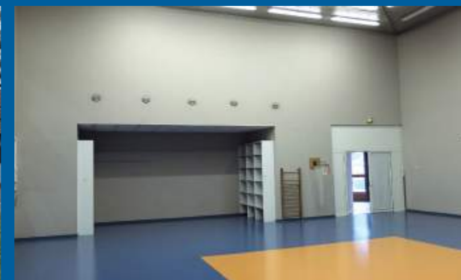
Bât. 4 - salle de motricité