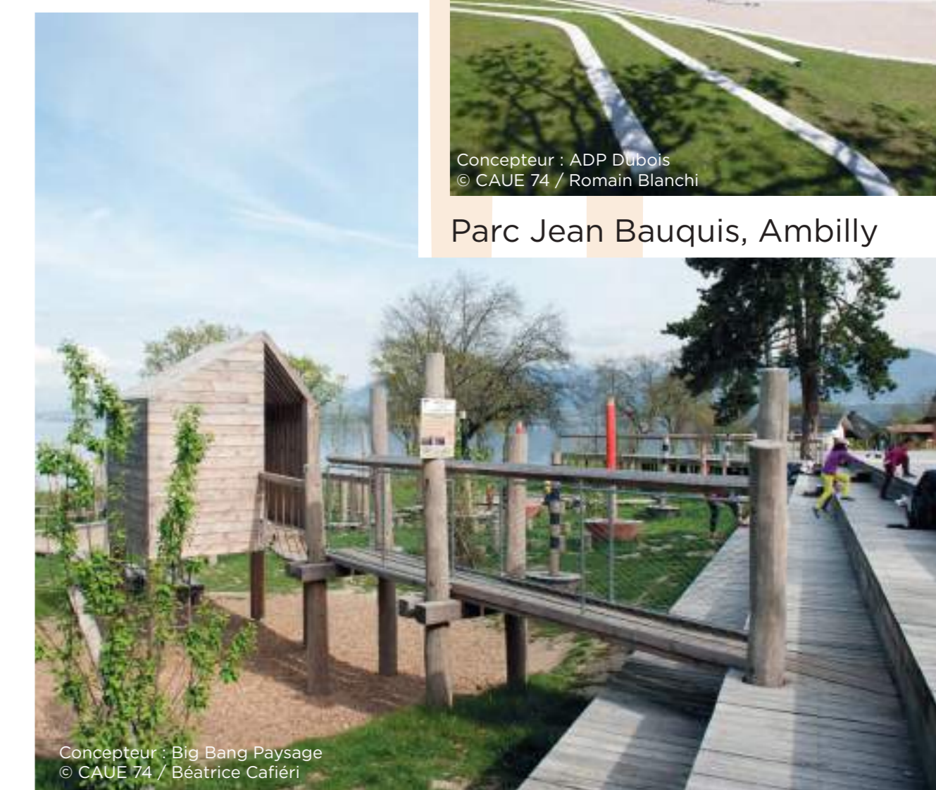
Concepteur : Big Bang Paysage