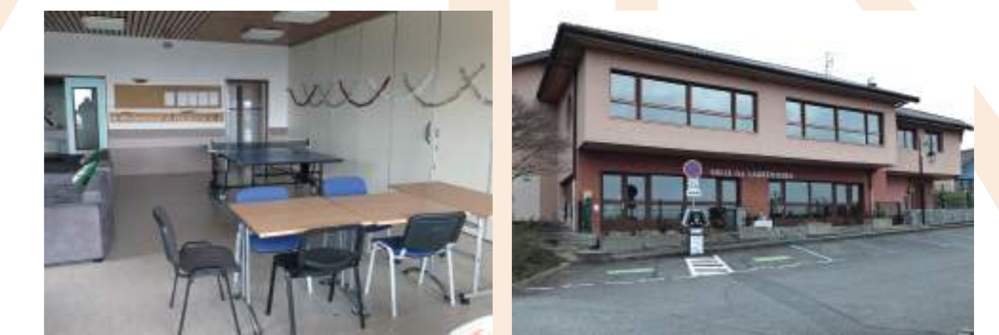
Bât. 4 - les Laurentides, ABCJ Bât. 4 - les Laurentides

Un espace de stockage : les espaces résiduels pourront servir de lieu de stockage selon les besoins (associations, médecins et/ou crèche).