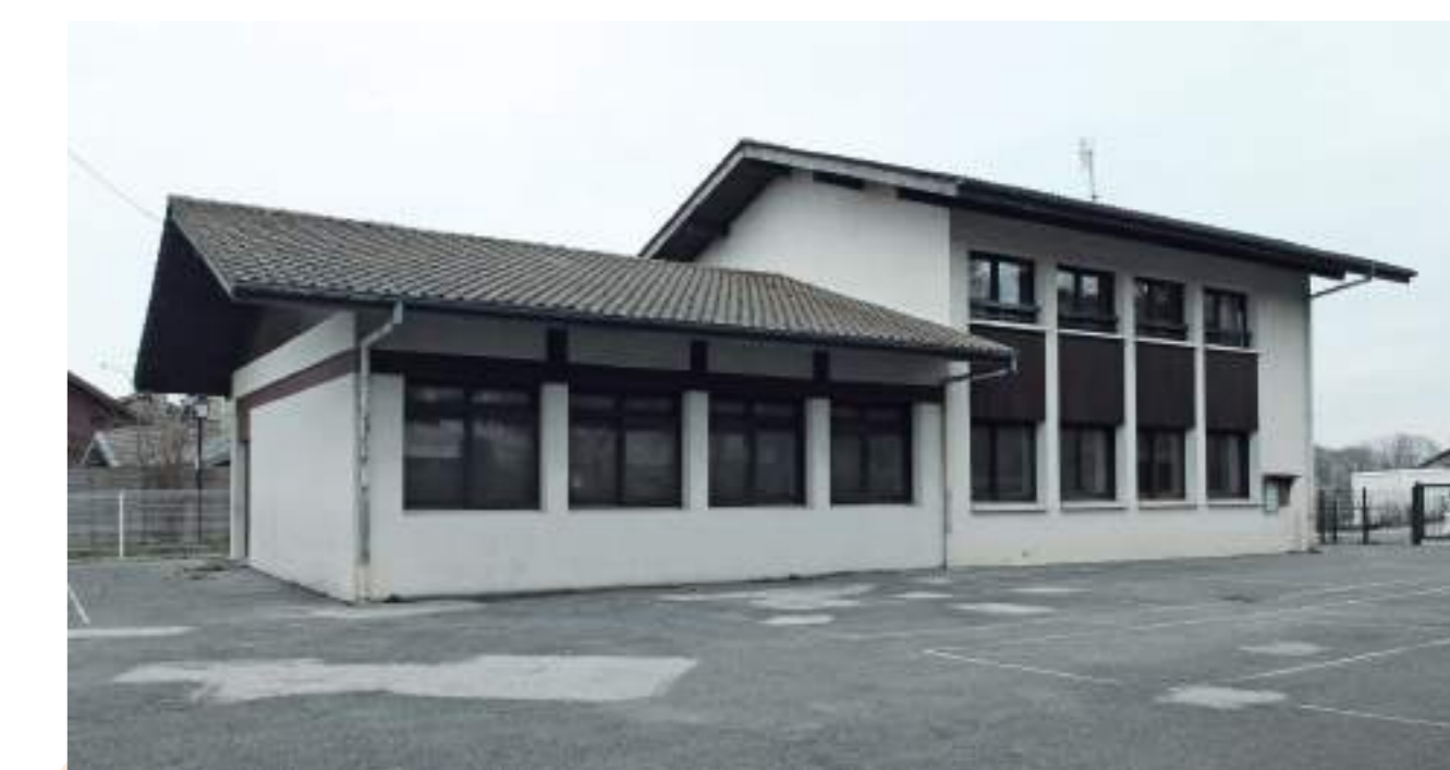
Bât. 2 - à démolir

Ce bâtiment, de faible qualité architecturale sera détruit pour libérer l'ancienne cour et créer un espace public type placette, ouvert sur la Mairie et un possible local commercial.