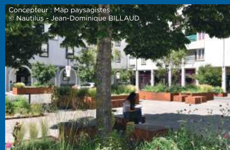
Place de la Galarne, Nantes