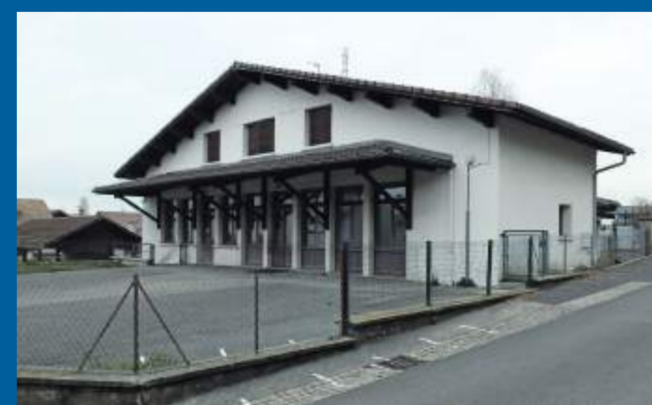
Bât. 1 - étage - salles de classe

Activités commerciales : les locaux donnant sur la future placette pourraient permettre l'implantation d'une activité commerciale.