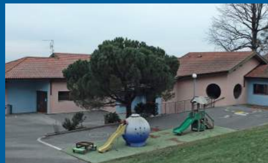
Bât. 4 - ancienne école maternelle