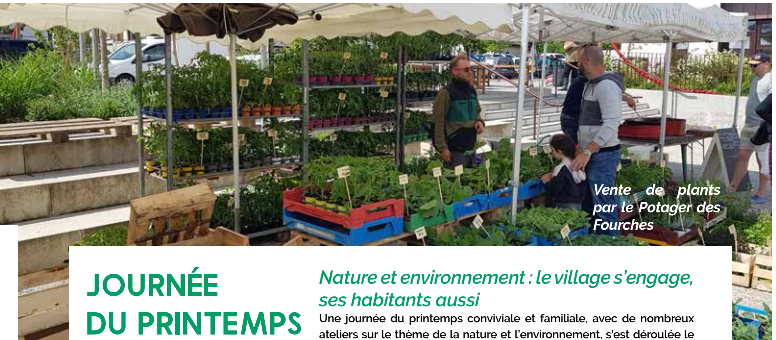
Vente de plants par le Potager des Fourches