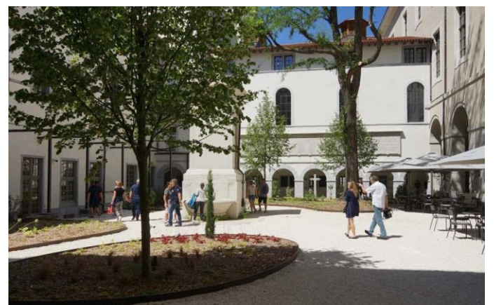
Cours Saint Louis, Lyon 1er. Espace public minéral et planté. Cours « cadrée » par les façades des bâtiments