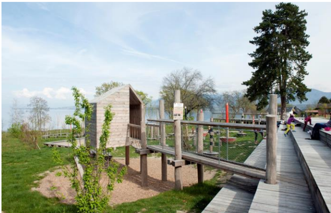
Parc du Pré Cottin, Excenevex

Photos de références pour illustrer ces intentions : merci d'indiquer si vous aimez ces ambiances à l'aide des pouces.