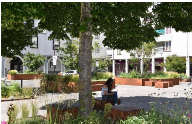
Place de la Galarne, Nantes