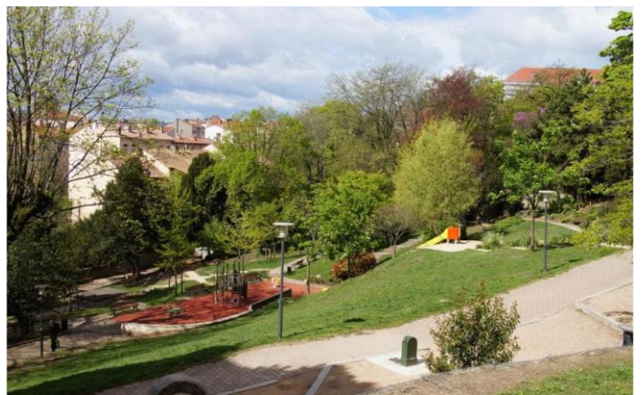
Le parc Sutter, Lyon 1er